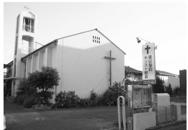
岡山聖約キリスト教会

牧師は「そういう話は聞いていない」と答えます。しかし、実はこの岡山聖約キリスト教会がヴォーリズ的设计なのかもしれないと明かしてくれたのです。