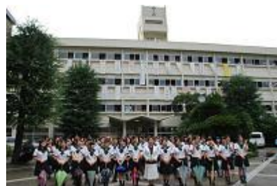
旧校舎との記念撮影