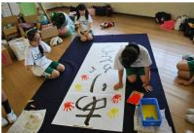
垂れ幕づくりの様子