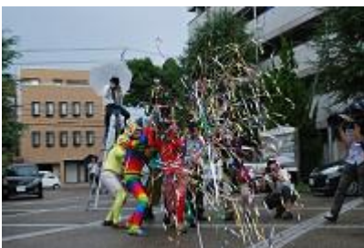
みさおレンジャーが登場