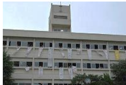
垂れ幕で飾った旧校舎